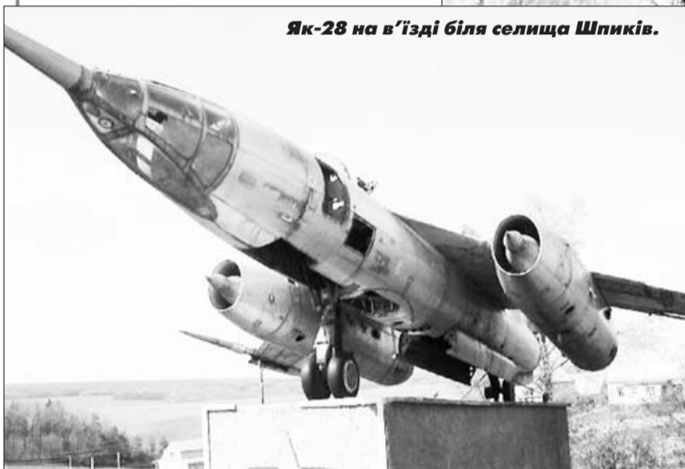
Як-28 на в'їзді біля селища Шпиків.